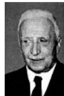
Presidente provvisorio della Repubblica Italiana

Ore 13,15 Conclusioni e consegna Costituzione